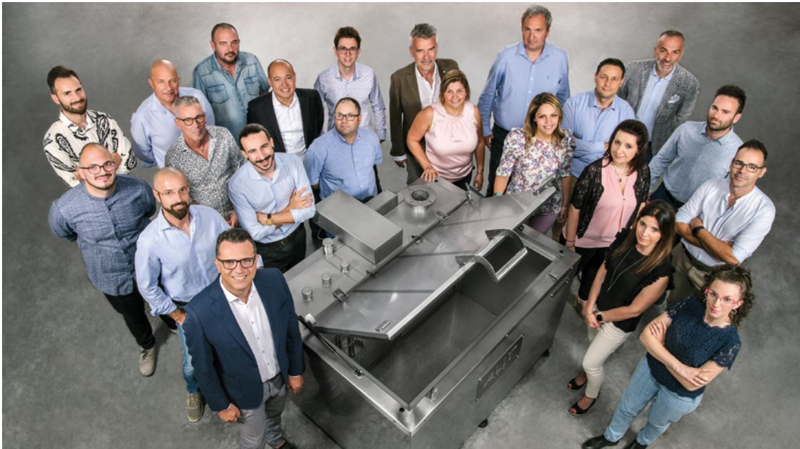
Zespół firmy ALIT

ugruntowaną pozycję na rynku obróbki powierzchniowej metali, wyróżnia ją wieloletnie doświadczenie i pełen profesjonalizm zarówno w doradztwie technologicznym, jak i w całokształcie prowadzenia relacji klient-odbiorca. Na terenie Polski znajdują się wiele firm z branży aluminiowej, motoryzacyjnej, AGD i lakierniczej, którym ALIT może zaoferować najbardziej optymalne rozwiązania.